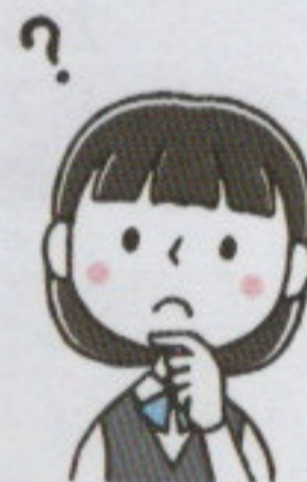
障がいのある方の雇用を検討している企業のCさん